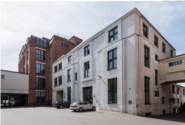
Halle G - Ostansicht (2020)