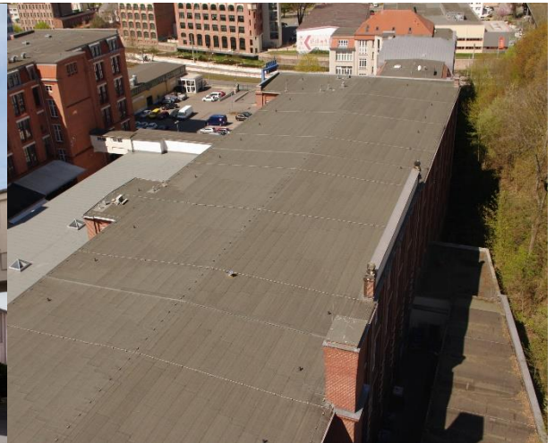
Halle G Dacherneuerung mit Dachdämmung (4/2020)